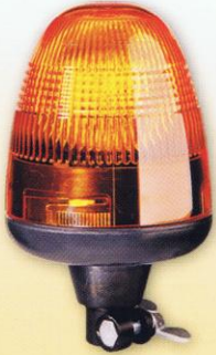
HELLA KL ROTAFLEX: Der stoßabsorbierende Sockel der Kennleuchte verringert die Gefahr von Beschädigungen.