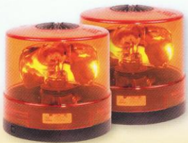
DIE RAUWERS LR-015 ist mit Drei-Punkt-Antivibrationsverbindung im Gehäuse ausgestattet, das Laufstörungen verhindern soll.